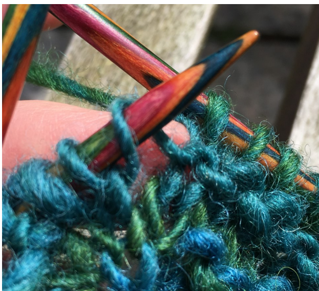
Umschlag vor der Eckmasche

Reihe 6 + 7 wiederholen, bis das Mittelfeld groß genug ist. Ich hatte 74 cm von Ecke zu Ecke, 291 g.